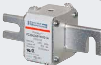
Fusibles PSC tailles 3X PROTISTOR® - Ultra Rapide