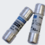
Fusible Cylindrique Basse Tension PROTISTOR® 10x38 (Courbes gR, Ultra Rapide)