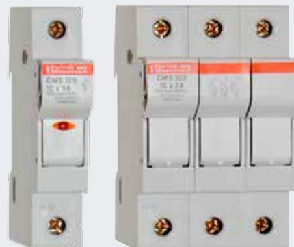
Porte fusibles MODULOSTAR® CMS 8/10, US10