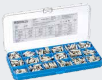
Fusibles miniatures THPC pour électronique 5x20 et 6x32 série FA, SA, SC (à très fort pouvoir de coupure)