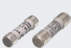
Fusibles Cylindriques Basse Tension CEI 8x32, 10x38 (Courbes aM et gG)

POUR L'ACHAT DE 5 CONDITIONNEMENTS D'UNE MÊME RÉFÉRENCE CONÇUE ET FABRIQUÉE EN FRANCE, LE SIXIÈME EST OFFERT !*